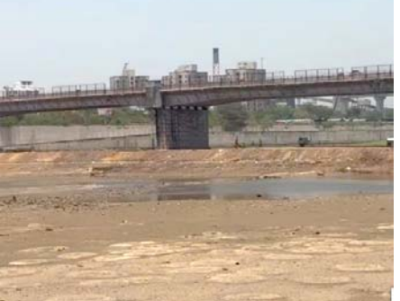
સાબરમતી નદી ખાલી કરાતા ભુલકાઓની વેકેશનની રજાઓ બગડી જવા પામે તેવી સ્થિતિ ઊભી થઈ છે. રજાઓમાં મોટીસંખ્યામાં બાળકો તથા મોટેરાઓનો સાબરમતી નદીના કિનારે મોટો ધસારો રહેતો હોય છે. ત્યારે આ સમારકામની કામગીરી નાતાલ બાદ તા. ૧ જાન્યુઆરીથી કરી ના શકાઈ હોત ? તેવા પ્રશ્નો ઊઠી રહ્યા છે રાજ્યમાં અમદાવાદ એક મહત્વપૂર્ણ પર્યટન સ્થળ છે. ત્યારે વેકેશન વેળા તા. ૧૭ જૂન સુધી બે માસ માટે આ રીતે સાબરમતી કોરી રાખવાનું કેટલું યોગ્ય છે તેવો પ્રશ્ન નાગરિકો કરી રહ્યા છે.

અમદાવાદ, તા. ૧૬ અમદાવાદની જવાહરોડી ગણાતી સાબરમતી નદીને લઈને મોટા સમાચાર સામે આવ્યા છે. વાસણા બેરેજના દરવાજાના નવીનીકરણ અને સમારકામ માટે સાબરમતી નદીને ખાલી કરવામાં આવી છે, જેના કારણે વર્ષો બાદ સાબરમતી નદીનો પટ કોરીધાકોર જોવા મળી રહ્યો છે. છલોછલ રહેતી સાબરમતીની નદી કોરીધાકોર જોવા મળતાં અજબ લાગતું હતું.