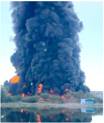
મેળવવાના યુદ્ધના ધોરણે પ્રયાસો હાથ ધરવામાં આવ્યા હતા. ગોડાઉનમાં જ્વલનશીલ અને સ્કેપ સામગ્રીનો જથ્થો હોવાથી આગ ઝડપથી પ્રસરી હતી, જેને કારણે ઓલવાવાની કામગીરીમાં ભારે મુશ્કેલીનો

અમદાવાદ, તા. ૧૬ સાણંદ-વિરમગામ હાઈવે પર છારોડી ગામ નજીક આવેલા એક સ્કેપના ગોડાઉનમાં આજે આચાનક ભીષણ આગ ફાટી નીકળી હતી. કિલોસ્કર ભરેલા કંપનીની પાસે આવેલા આ ગોડાઉનમાં લાગેલી આગે જોતજોતામાં વિકરાળ સ્વરૂપ ધારણ કરતા સમગ્ર વિસ્તારમાં અફરાતફરી મચી ગઈ હતી. આગ એટલી પ્રચંડ હતી કે તેના કાળા ધુમાડાના આકાશચૂંબી ગોટેગોટા દૂર-દૂર સુધી જોઈ શકાતા હતા. ફાયર બ્રિગેડની મહામહેનતે આગ કાબૂમાં આવી છે આગમાં સ્કેપનો જથ્થો બળીને ખાખ થઈ જવા પામ્યો છે. આગની જાણ થતા જ સ્થાનિકોએ તુરંત ફાયર વિભાગને જાણ કરી હતી. ઘટનાની ગંભીરતાને જોતા ફાયર બ્રિગેડની અનેક ટીમો તાત્કાલિક અસરથી સ્થળ પર પહોંચી ગઈ હતી. ફાયર ફાઈટરો દ્વારા સતત પાણીનો મારો ચલાવીને આગ પર કાબૂ