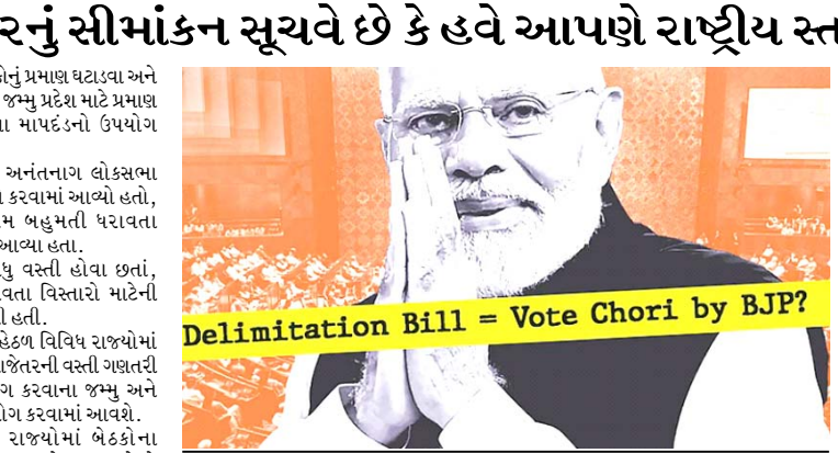
ગેરીમેન્ડરિંગ એટલે જીતવા માટે ચૂંટણી ક્ષેત્રોની સીમાઓ સાથે છેડછાડ કરવી

કિસ્કો વિરોધ કર્યો છે કે, તાજેતરના આસામ અને જમ્મુ-કાશ્મીરના ઉદાહરણોનો ઉપયોગ કરીને, નરેન્દ્ર મોદી સરકારનું સીમાંકન બિલ લોકસભા બેઠકોને કેવી રીતે ફરીથી આકાર આપી શકે છે. આ અહેવાલ વસ્તી ડેટાના પસંદગીયુક્ત ઉપયોગ, ગેરીમેન્ડરિંગ અને વિપક્ષ-મજબૂત પ્રદેશો, ખાસ કરીને દક્ષિણ, પંજાબ અને કાશ્મીર પર તેની અસર પર ધ્યાન કેન્દ્રિત કરે છે. શું ભાજપના રાજકીય લાભને વધારવા માટે સીટની સીમાઓ ફરીથી બનાવવામાં આવી રહી છે? નરેન્દ્ર મોદી સરકાર સીમાંકન બિલ રજૂ કરવા માટે તૈયાર છે. બિલમાં મતવિસ્તારોની સીમાઓ ફરીથી દોરવામાં આવશે અને લોકસભાની કુલ બેઠકોની સંખ્યા ૫૪૩થી વધારીને ૮૫૦ કરવામાં આવશે. નવીનતમ વસ્તી ગણતરી મુજબ દરેક રાજ્યમાં કુલ બેઠકોની સંખ્યા બદલવામાં આવશે.