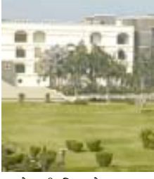
કેસની વિગતો મુજબ, જોતા જજ, તેમની પત્ની અને સાળા સામે ACBએ ભ્રષ્ટાચાર નિવારણ અધિનિયમ અંતર્ગત ગુનો નોંધ્યો હતો. જેની રિપોર્ટ તેને ઉપરી ઓથોરિટીને આપ્યો ન હતો. વળી તેમની ઉપર લાંચ લેવાની

(સંવાદદાતા દ્વારા) અમદાવાદ, તા.૧૭ અમદાવાદ ગ્રામ્ય કોર્ટે ૨૦૧૧માં ચુકાદો આપતા ભ્રષ્ટાચાર નિવારણ અધિનિયમ અંતર્ગત આવક કરતા વધુ સંપત્તિના કેસમાં વલસાડના પારડીમાં તત્કાલીન સિવિલ જજ અને મેજિસ્ટ્રેટ પ્રેમજી ગોહિલને ૨ વર્ષ કેદની સજા અને ૧૦ હજાર રૂપિયાનો દંડ ફટકાર્યો હતો. જેની સામે જજે ગુજરાત હાઈકોર્ટમાં અપીલ દાખલ કરી હતી. જો કે હાઈકોર્ટે જજની અપીલ નકારી નાખતા. તેમને ૧૫ દિવસની અંદર જેલ સમક્ષ સરેન્ડર કરવા માટે હુકમ કરવામાં આવ્યો છે.