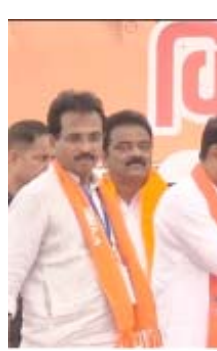
રહેતી પ્રજા પ્રાથમિક જરૂરીયાતો માટે વલખા મારતી હતી. પરંતુ જ્યારે મુખ્યમંત્રી તરીકે હાલના વડાપ્રધાને સન્માન સુગો સંભાળ્યા બાદ ગુજરાતના વિકાસ માટે અનેક યોજનાઓ અમલી બનાવી છે. જેથી સ્થાનિક સ્વરાજ્યની ચૂંટણીઓમાં કાર્યકરોએ

(સંવાદદાતા દ્વારા) હિંમતનગર, તા.૧૭ સ્થાનિક સ્વરાજ્યની ચૂંટણીઓમાં ભાજપના ઉમેદવારોના પ્રચારાર્થે શુક્રવારે ગુજરાતના મુખ્યમંત્રી અરવલ્લીનો પ્રવાસ પુરો કરીને સીધા સાબરકાંઠા જિલ્લાના મુખ્ય મથક હિંમતનગર ખાતે આવ્યા હતા. જ્યાં તેમણે ચૂંટણી કાર્યાલયનું ઉદ્ઘાટન અને નાગરિકો સાથે સંવાદ કર્યા બાદ મુખ્યમંત્રીએ હિંમતનગરના હડીયોલ રોડ પર આવેલ એક પાનગી પાર્ટી પ્લોટમાં જઈને વિકાસ સંકલ્પ સભા સંબોધી હતી. જેમાં તેમણે ગુજરાતના વડાપ્રધાને સન્માન સુગો સંભાળ્યા બાદ ગુજરાતના વિકાસ માટે અનેક યોજનાઓ અમલી બનાવી છે. જેથી સ્થાનિક સ્વરાજ્યની ચૂંટણીઓમાં કાર્યકરોએ