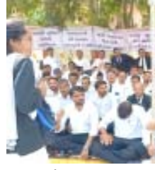
ન્યાય મેળવવા આવતા સામાન્ય નાગરિકોને મુશ્કેલીઓનો સામનો કરવો પડશે. વકીલોનું કહેવું છે કે, કોર્ટ સંકુલ જગાણા ખસેડવાથી પક્ષકારો અને વકીલો બંને પર વધારાનો આર્થિક બોજ પડશે. આવાગમનનો ખર્ચ, સમય

સીબીએસઈ ધોરણ ૧૦ બોર્ડની પરીશાઓ ૨૦૨૬માં P.W.ના વિદ્યાર્થીઓએ મેળવી ભય સહગતા અમદાવાદ, તા.૧૭