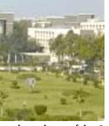
જ્યારે જજને ૨ વર્ષ કેદની સજા કરવામાં આવી હતી. જજે પોતાના હોદાનો દુરુપયોગ કરીને ૭ લાખ રૂપિયાની ભેટ ચેક સ્વરૂપે સ્વીકાર્યાનો આક્ષેપ છે. જેનો રિપોર્ટ તેને ઉપરી ઓથોરિટીને આપ્યો ન હતો. વળી તેમની ઉપર લાંચ લેવાની

આદતનો આક્ષેપ છે. જેઓ પોતાની કોર્ટમાં આવેલા કેસમાં ફેવર કરતા હતા. અરજદારના કુટુંબમાં એક ભિલકતની ખરીદી ૫.૫૧ લાખ રૂપિયામાં થઈ હતી. જેની બજાર કિંમત ૩૬ લાખ રૂપિયા જેટલી હતી. વળી જજે એક આરોપી પાસેથી પોતાના નિવાસ સ્થાનની બહારનો રોડ બનાવવડ્યો હતો. હાઈકોર્ટે નોંધ્યું હતું કે, ભેટ આપનાર વ્યક્તિ સાથે અરજદાર આરોપીને કોઈ પારિવારિક સંબંધ નહોતો. અરજદારે ઉપરોક્ત રકમ કાયદેસરના કાનૂનમાંથી મેળવી છે, તેવું તે સાબિત કરી શક્યા નથી.