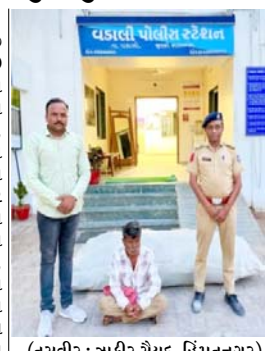
(તસવીર : ઝાકીર સૈયદ, હિંમતનગર) હિંમતનગરના હિંમતનગર પોલીસ સ્ટેશનના સર્વેલન્સ સ્ટાફના કર્મચારીઓ નિયમિત પેટ્રોલિંગમાં હતા. તે દરમિયાન અ.હે. કોન્સેબલ હિંમતનગરના હિંમતનગર પોલીસ સ્ટેશનના સર્વેલન્સ સ્ટાફના કર્મચારીઓ નિયમિત પેટ્રોલિંગમાં હતા. તે દરમિયાન અ.હે. કોન્સેબલ

(સંવાદદાતા દ્વારા) હિંમતનગર, તા. ૧૭ 'SAY NO TO DRUGS' ઝુંબેશ અંતર્ગત વડાલી પોલીસે એક મહત્વ પૂર્ણ સફળતા હાંસલ કરી છે, વડાલી પોલીસ સ્ટેશન વિસ્તારમાં આવેલ કેસરપુરા ગામની સિમમાં ગેરકાયદેસર રીતે ગાંજાનું વાવેતર કરતા એક આરોપીનો મુદ્દામાલ સાથે ઝડપી પાડવામાં આવ્યો છે, વડાલી પોલીસ સ્ટેશનના સર્વેલન્સ સ્ટાફના કર્મચારીઓ નિયમિત પેટ્રોલિંગમાં હતા. તે દરમિયાન અ.હે. કોન્સેબલ