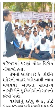
પરિસરમાં ધરણાં યોજી વિરોધ નોંધાવ્યો હતો. તેમનો આરોપ છે કે, કોર્ટને શહેરની બહાર ખસેડવાથી ન્યાય મેળવવા આવતા સામાન્ય નાગરિકોને મુશ્કેલીઓનો સામનો કરવો પડશે. વકીલોનું કહેવું છે કે, કોર્ટ સંકુલ જગાણા ખસેડવાથી પક્ષકારો

(સંવાદદાતા દ્વારા) પાલનપુર, તા. ૧૭ પાલનપુરમાં આવેલી કોર્ટ જગાણા ખસેડવાના નિર્ણય સામે હવે વિરોધના સ્વર ઉગ્ર બન્યા છે. જોરાવર પેલેસમાં આવેલી કોર્ટને શહેરથી દૂર જગાણા ગામમાં ખસેડવાની તજવીજ સામે આજે વકીલોએ ધરણાં યોજી પ્રદર્શન કર્યું હતું અને સ્પષ્ટ શબ્દોમાં ચેતવણી આપી કે, જે નિર્ણય પાછો નહીં ખેંચાય તો આંદોલન વધુ તેજ બનાવાશે. પાલનપુરના જોરાવર પેલેસમાં ચાલી રહેલી કોર્ટને લગભગ સાત કિલોમીટર દૂર જગાણા ખસેડવાની પ્રક્રિયા શરૂ થઈ છે. પરંતુ આ નિર્ણય સામે વકીલોનું સમુદાયમાં ભારે અસંતોષ જોવા મળી રહ્યો છે. વકીલોએ કોર્ટ