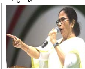
ટિપ્પણીના જવાબમાં, ટીએમસીના વડાએ મોદી પર કટાક્ષ કર્યો, શું તેઓ પશ્ચિમ બંગાળના મુખ્યમંત્રી બનવા માંગે છે. બેનરજીએ કહ્યું કે, મોદીનું એવું નિવેદન કે તેઓ બધી ૨૯૪ વિધાનસભા બેઠકો આરોપ લગાવ્યો કે તેનો ઉપયોગ બાળકોને પર ઉમેદવાર છે તે ૨૦૨૧થી ચૂંટણી પ્રચાર દરમિયાન તેમના પોતાના વારંવારના દાવાને પ્રતિબિંબિત કરે છે. રવિવારે પ્રભાવિત કરવા માટે થઈ રહ્યો છે. ઉત્તર પ્રદેશના મુખ્યમંત્રી યોગી આદિત્યનાથ દ્વારા રવિવારે કરવામાં આવેલી ટિપ્પણીનો ઉલ્લેખ કરતા તેમણે તેની ટીકા કરી હતી. યોગીએ કહ્યું હતું કે, પશ્ચિમ બંગાળમાં બુલડોઝર દાંડશે, બેનરજીએ વળતો પ્રહાર કરતા કહ્યું કે તેમની સરકાર આવા અભિગમમાં નહીં પરંતુ પ્રેમ પર આધારિત અભિગમમાં માને છે. અમે બુલડોઝર નીતિમાં માનતા નથી. અમે પ્રેમની નીતિમાં માનીએ છીએ. બેનરજીએ લોકોને ભાજપ પાસેથી પૈસા સ્વીકારવા સામે ચેતવણી પણ આપી હતી અને અનુસંધાન બીજા પાને

(એજન્સી) તા. ૧૩ પશ્ચિમ બંગાળના મુખ્યમંત્રી મમતા બેનરજીએ સોમવારે બીરભૂમના સુરી પાતે એક ચૂંટણી રેલીને સંબોધતા જણાવ્યું હતું કે, તેઓ એકલા હાથે જનતાના કલ્યાણ માટે લડી રહ્યા છે. તેમણે દાવો કર્યો હતો કે NDA અને કેન્દ્ર શાસિત ૧૯ રાજ્યોએ તેમનો સામનો કરવા માટે એક સાથે આવવું પડશે. તેમણે એમ પણ કહ્યું હતું કે ભાજપ 'દિલ્હી દળો'નો ઉપયોગ કરીને પશ્ચિમ બંગાળની ચૂંટણી જીતી શકશે નહીં. બેનરજીએ એવો પણ આરોપ લગાવ્યો હતો કે વડાપ્રધાન નરેન્દ્ર મોદીનો 'મન કી બાત' કાર્યક્રમ ફક્ત યુવા મન પર પ્રભાવ પાડવા અને પ્રભાવિત કરવા માટે ચલાવવામાં આવી રહ્યો છે. તેણીએ કહ્યું કે, ૨૩ અને ૨૯ એપ્રિલના રોજ બે તબક્કામાં યોજનારી પશ્ચિમ બંગાળ વિધાનસભાની ચૂંટણીમાં તૃણમૂલ કોંગ્રેસ ૨૨૬થી વધુ બેઠકો મેળવશે. ભાજપના લોકો પૈસા વહેંચી રહ્યા છે. તેમણે બધા નોકરશાહો અને પોલીસને બીજા રાજ્યોમાં ટ્રાન્સફર કર્યા છે જેથી કોઈ તેમને પકડી ન શકે. પૈસા, ડ્રગ્સ, હથિયારો અને મતદારોને પશ્ચિમ બંગાળમાં તસ્કરી કરવામાં આવી રહ્યા છે. મતદારોને મતદાન કરવા માટે બિહારથી ટ્રેનો અને બસોમાં લાવવામાં આવી રહ્યા છે. બધી બેઠકો પર ઉમેદવાર હોવાની તેમની