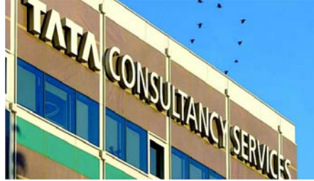
છે અને તે ટ્રસ્ટના ઉલ્લંઘનથી તેમના માનસિક સ્વાસ્થ્ય અને કારકિર્દી પર હાન્યા ગાળાની અસર પડે છે.

વધુમાં સંસ્થાએ સરકારને સમગ્ર મહારાષ્ટ્રમાં IT અને ITES કંપનીઓનું વ્યાપક ઓડિટ કરવા વિનંતી કરી છે. આમાં કાર્યકારી પરિસ્થિતિઓ ફરિયાદ નિવારણ પદ્ધતિઓ, કર્મચારી લાભો, કરાર આધારિત પ્રથાઓ અને શ્રમ કાયદાઓનું એકંદરે પાલન તપાસવાનો સમાવેશ થાય છે. તેણે ક્ષેત્રમાં જવાબદારી સુનિશ્ચિત કરવા માટે સમયાંતરે ફરજિયાત ઓડિટની પણ ભલામણ કરી છે.