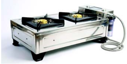
મહત્વપૂર્ણ છે. પણ તે ફક્ત ઘરો કરતાં વધુ માટે બનાવવામાં આવ્યું છે. તેનો ઉપયોગ ઘરના રસોડામાં થઈ શકે છે, પણ તેનું વર્તમાન ધ્યાન વ્યાપક છે.

તેનું અન્વેષણ આ માટે થઈ રહ્યું છે: ● સરકારી સ્વચ્છ-ઊર્જા પ્રોજેક્ટ્સ ● સંશોધન અને પરીક્ષણ પ્રયોગશાળાઓ ● સમુદાય રસોડા અને કેન્ટીન ● સંરક્ષણ અને દૂરસ્થ સ્થાનો ● સંસ્થાકીય અને ઔદ્યોગિક રસોડા તે માત્ર ગ્રાહક ઉત્પાદન નથી, તે મોટા ઉર્જા પ્રયોગોનો પણ એક ભાગ છે. સલામતીની વિગતો હાઈડ્રોજન સામેલ હોવાથી, સલામતી પ્રણાલીઓ ડિઝાઇનમાં બનેલી છે. ● મુખ્ય સુવિધાઓમાં આ સામેલ છે: ● જ્યોત નિયંત્રિત કરનાર ● દબાણ નિયમન પ્રણાલી ● હાઈડ્રોજન-સુસંગત વાલ્વ ● ટકાઉ સ્ટેનલેસ-સ્ટીલ બોડી તે લાંબા સમય સુધી સ્થિર અને નિયંત્રિત ઉપયોગ સુનિશ્ચિત કરવામાં મદદ કરે છે. કિંમત અને વ્યવહારિકતા આશરે રૂ. ૧,૫૦,૦૦૦ પ્રતિ સ્ટોવ હાલમાં રોજિંદા ઘરો માટે બનાવાયેલ નથી. તે તેની વર્તમાન ભૂમિકા આ સાથે વધુ સંરેખિત છે: ● પાયલોટ પ્રોજેક્ટ્સ ● સ્વચ્છ ઊર્જાનું પરીક્ષણ કરતી સંસ્થાઓ ● મોટા રસોડા તેની સસ્તી કિંમત, હાઈડ્રોજનની એક્સેસ અને દૈનિક ઉપયોગની સરળતા પર આધાર રાખશે. આ હાઈડ્રોજન રસોઈ સ્ટોવ બતાવે છે કે રસોડાની ટેકનોલોજી ક્યાં જઈ શકે છે, સિલિન્ડરોથી દૂર અને વૈકલ્પિક ઈંધણ તરફ. તે ઘરોમાં LPGને તાત્કાલિક બદલી શકશે નહીં, પરંતુ તે રસોઈની નવી રીતો તરફ એક પગલું છે.