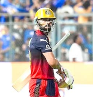
ટીમની આક્રમક બેટિંગ અને જીત કોહલીની ધીમી ઈનિંગ છતાં, ફિલ સોલ્ટની ફેરે છે કે નહીં.

મુંબઈ, તા. ૧૩ IPL ૨૦૨૬માં રવિવારે મુંબઈ ઈન્ડિયન્સ સામેની રોમાંચક જીત બાદ રોયલ ચેલેન્જર્સ બેંગ્લુરુ (RCB)ના છાવણીમાંથી એક ચિંતાજનક સમાચાર સામે આવ્યા છે. વાનખેડે સ્ટેડિયમમાં રમાયેલી આ મેચની બીજી ઈનિંગમાં ટિગ્ગર બેટર વિરાટ કોહલી કિલિંગ માટે મેદાનમાં ઉતર્યા નહોતા, જેના કારણે ચાહકોમાં તેમની ફિટનેસને લઈને ચર્ચાઓ જાગી હતી. મેચ બાદ કેપ્ટન રજત પાટીદારે કોહલીની ઈજા અંગે મહત્વનું અપડેટ આપ્યું હતું. સાવચેતીના ભાગરૂપે ફિલિંગથી રહ્યા દૂર વિરાટ કોહલીએ આ મેચમાં ૩૮ બોલમાં ૫૦ રનની ઈનિંગ રમી હતી, પરંતુ આ દરમિયાન તેઓ પોતાની લય માટે સંઘર્ષ કરતા દેખાયા હતા. આઉટ થયા બાદ તે ઘણા નારાજ પણ જણાતા હતા. અહેવાલો અનુસાર, એન્કલ (ઘૂંટી)ની સમસ્યાને કારણે તેઓ કિલિંગમાં આવ્યા નહોતા. પોસ્ટ-મેચ પ્રેજન્ટેશનમાં રજત પાટીદારે જણાવ્યું કે, "મને અત્યારે ચોક્કસ ખબર નથી, પરંતુ મને લાગે છે કે તે ઠીક છે." પાટીદારના જણાવ્યા અનુસાર, કોહલીને મેદાનની બહાર રાખવાનો નિર્ણય માત્ર એક સાવચેતીના ભાગરૂપે લેવામાં આવ્યો હતો.