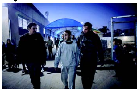
બાળકો અને ૭૩ મહિલાઓનો સમાવેશ થાય છે. પેલેસ્ટીની અને ઈઝરાયેલી માનવધિકાર જૂથોએ કહ્યું છે કે કેદીઓને ત્રાસ, ભૂખમરો અને તબીબી ઉપેક્ષાનો સામનો કરવો પડે છે, જેના કારણે ડાહ્યાક મૃત્યુ થાય છે. ઓક્ટોબર ૨૦૨૩થી, ઈઝરાયેલ ગાઝા પટ્ટીમાં તેના યુદ્ધની સાથે પેલેસ્ટીની કેદીઓ સામે પગલાં વધુ તીવ્ર બનાવ્યા છે. આ સંઘર્ષ ગાઝામાં ૭૨,૦૦૦થી વધુ લોકો માર્યા ગયા છે અને ૧, ૭૨, ૦૦૦ ઘાયલ થયા છે, જેમાંથી મોટાભાગની મહિલાઓ અને બાળકો છે.

(એજન્સી) તા. ૧૩ સેવ ધ બિલ્ડિંગના અહેવાલમાં જણાવવાયું છે કે ઈઝરાયેલી અટકાયતમાં રાખવામાં આવેલા પેલેસ્ટીની બાળકોએ કથિત દુર્ઘવહારનો સામનો કર્યો છે, જેમાં ૭ ઓક્ટોબર, ૨૦૨૩ થી સ્થિતિ વધુ ખરાબ થઈ ગઈ છે. અમ સેવ ધ બિલ્ડિંગના અહેવાલમાં શનિવારે દૈનિક ડી સ્ટેન્ડાર્ડ અનુસાર જણાવવાયું છે. રિપોર્ટમાં કહેવામાં આવ્યું છે કે લગભગ ૩૫૦ પેલેસ્ટીની બાળકો હાલમાં ઈઝરાયેલી અટકાયતમાં રાખવામાં આવ્યા છે, જેમાં પ્રી-ટ્રાયલ અને વહીવટી અટકાયત બંનેનો સમાવેશ થાય છે. જેમાં કોઈ આરોપ વિના અટકાયત કરવામાં આવી છે. તેમાં આરોપ મુકવામાં આવ્યો છે કે બાળકોને કાર્યકારી હિંસા, લાંબી પૂછપરછ અને નબળી અટકાયતની સ્થિતિનો ભોગ બનવું પડ્યું છે, જેમાં ભીડભાડ અને પરિવારના સંપર્કની મર્યાદિત એક્સેસનો સમાવેશ થાય છે. રિપોર્ટ અનુસાર, માનવતાવાદી સંગઠનોને અટકાયત સુવિધાઓ સુધી પહોંચ મર્યાદિત કરવામાં આવી છે. જે પરિસ્થિતિઓનું સ્વતંત્ર નિરીક્ષણ મર્યાદિત કરે છે. સેવ ધ બિલ્ડિંગે પેલેસ્ટીની બાળકોની અટકાયતનો અંત લાવવા હાકલ કરી હતી અને ૨૬ ફોસની આંતરરાષ્ટ્રીય સમિતિ સહિત સ્વતંત્ર નિરીક્ષકો માટે સંપૂર્ણ એક્સેસનો આહ્વાન કર્યો હતો. 'ઈઝરાયેલ સાથે વિશેષાધિકાર સંબંધો જાળવી રાખીને, યુરોપિયન યુનિયન પણ આમાં ભાગીદાર છે,' યુએસ સોશિયલ મીડિયા કંપની X પર યુરોપિયન સંસદના બેલ્જિયન સભ્ય માર્ક બોલેટોએ જણાવ્યું. ઈઝરાયેલી જેલોમાં ૮, ૫૦૦થી વધુ પેલેસ્ટીનીઓ કેદ છે, જેમાં ૩૫૦