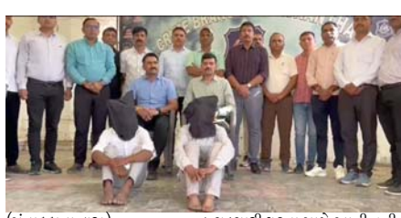
(સંવાદદાતા દ્વારા) પાલનપુર, તા. ૮ પાલનપુર-અંબાજી હાઈવે પર ધનપુરા પાટિયા નજીકથી એક બાળકના અપહરણની ચક્રચારી ઘટના સામે આવી હતી. જોકે, પોલીસે ગણતરીના કલાકોમાં બે આરોપીને ઝડપી લઈ આંતર રાજ્ય બળ તસ્કરીના ગુનાનો પર્દાફાશ કરી વધુ તપાસ

હાથ ધરી છે. પાલનપુરના ધનપુરા પાટિયા પાસે તાજેતરમાં ચોકલેટની લાલચે એક શ્રમિક બાળકનું અપહરણ થતા પોલીસ તંત્ર પણ ચોકી ઉઠ્યું હતું. ઘટનાની જાણ થતાં જ પોલીસ તંત્ર દોડતું થયું હતું. પોલીસે ઓપરેશન દેવ શરૂ કરી LCB અને SOG સહિતની ટીમો બનાવી ટેકનિકલ સર્વેલન્સના આધારે આરોપીની શોધખોળ શરૂ કરી હતી. જેમાં પોલીસે ૮૦ કિલો મીટર સુધીના સીસીટીવી ફૂટેજ ચેક કરી આરોપીઓનું પગરું મેળવી બંને આરોપીઓને દબોલી લીધા હતા. આ અંગે બનાસકાંઠા એસ.પી.એ આંતર રાજ્ય બાળ તસ્કરીનો પર્દાફાશ કરતા જણાવ્યું હતું કે, આ આરોપીઓ બાળકનું અપહરણ કરી તેને રાજ્ય બહાર વેંચતા હતા. આ લોકોએ આંતર રાજ્ય એક બાળકને એક લાખ રૂપિયામાં વેચી હોવાનું બહાર આવતા પુદ પોલીસ પણ ચોકી ઉઠી હતી.