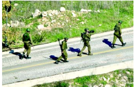
પછી પણ ચાલુ લશ્કરી કામગીરી જાળવી રાખીને ફન્ટ-લાઈન ગામડાઓને નિયંત્રિત કરવાનો સમાવેશ થાય છે. નવેમ્બર ૨૦૨૪માં અમલમાં આવેલા યુદ્ધવિરામ છતાં, ૨ માર્ચે હિઝબુલ્લાહ દ્વારા સરહદ પારના હુમલા પછી ઈઝરાયેલે દક્ષિણ લેબેનોનમાં હવાઈ હુમલા અને ભૂમિ હુમલા કર્યા છે. લેબેનોન અધિકારીઓએ જણાવ્યું હતું કે ઈઝરાયેલી હુમલાઓમાં ઓછામાં ઓછા ૧,૪૮૭ લોકો માર્યા ગયા છે અને ૪,૬૩૯ અન્ય ઘાયલ થયા છે.

(એજન્સી) ટા.૮ ઈઝરાયેલી સેનાએ મંગળવારે દક્ષિણ લેબેનોનમાં એક વધારાનો ડિવિઝન તૈનાત કર્યો હતો, કારણ કે ઈઝરાયેલ આરબ દેશમાં તેના ચાલુ ભૂમિ હુમલાને વિસ્તૃત કરવાનું ચાલુ રાખે છે. એક નિવેદનમાં, સેનાએ જણાવ્યું હતું કે ૯૮મી ડિવિઝન ૯૧મી, ૯૬મી, ૧૪૬મી અને ૧૬૨મી ડિવિઝન સાથે 'જમીન કામગીરીના વિસ્તરણના ભાગ રૂપે', દક્ષિણ લેબેનોનમાં ચાલી રહેલા તોપખાના અને હવાઈ હુમલાઓ સાથે કામગીરીમાં જોડાઈ હતી. લશ્કરે જણાવ્યું હતું કે વધારાના દળો લેબેનોન પ્રદેશમાં ઘસણખોરીની હદનો ઉલ્લંઘ કર્યા વિના 'આગળની રક્ષણાત્મક રેખાને મજબૂત બનાવવા અને ઉત્તરીય રહેવાસીઓ માટેના જોખમોને દૂર કરવા' માટે કામ કરી રહ્યા છે. દૈનિક યેટિઓથ અહરોનોથ અનુસાર, ઈઝરાયેલી પગલાનો હેતુ લિટાની નદીની ઉત્તરે હિઝબુલ્લાહ લડવાયાઓને ધક્કેલવાનો અને સરહદી ગામોમાં સ્થળો અને ઈમારતોનો નાશ કરવાનો છે જેનો ઉપયોગ ઈઝરાયેલના દાવાઓ લશ્કરી હેતુઓ માટે થાય છે. અખબારે ઉમેર્યું હતું કે ભૂપ્રદેશને કારણે દક્ષિણ લેબેનોનમાં કામગીરી ગાઝા કરતાં 'વધુ જટિલ' છે. આ અખબારમાં જણાવાયું છે કે સેના રાજકીય અધિકારીઓ સમક્ષ એક ઓપરેશનલ પ્લાન રજૂ કરવાની તૈયારી કરી રહી છે જેમાં ઈરાન સાથે યુદ્ધ સમાપ્ત થયા