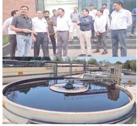
અંકલેશ્વર વેસ્ટ મેનેજમેન્ટ એસોસિએશનના સભ્યો અને GPCBના અધિકારીઓ સાથે સંબંધિત વ્યવસ્થાઓ સંબંધિત ચર્ચા કરવામાં આવેલી તસ્વીર.

અંકલેશ્વર, તા.૮ ગુજરાત પ્રદૂષણ નિયંત્રણ બોર્ડ (GPCB) અને અંકલેશ્વર વેસ્ટ મેનેજમેન્ટ એસોસિએશન વચ્ચે લાંબા સમયથી ચાલી રહેલા વિવાદનો સુખદ અંત આવ્યો છે. કરોડો રૂપિયાના ખર્ચે તૈયાર થયેલા કોમન એક્લુએન્ડ ટ્રીટમેન્ટ પ્લાન્ટ (CETP) પ્રોજેક્ટને GPCB દ્વારા ૫ વર્ષ માટે CCA (ક્લેન્ડ ફોર એસ્ટેબ્લિશમેન્ટ એન્ડ ઓપરેશન) મંજૂરી આપવામાં આવી છે. આ નિર્ણયથી અંકલેશ્વરના ઉદ્યોગ જગતમાં રાહત અને ખુશીનો માહોલ જોવા મળી રહ્યો છે.