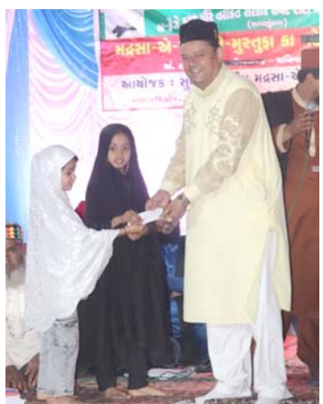
રાજકોટ, તા. ૮ રજા-એ-મુસ્તુફા એજ્યુકેશન એન્ડ ચેરિટીબલ ટ્રસ્ટ દ્વારા વિદ્યાર્થીઓને ઈનામ વિતરણ સમારોહ યોજાયો હતો. રમઝાન માસ દરમિયાન નાના ભુલકાઓએ રોજા રાખેલ તેઓને પણ ઈનામોથી નવાજવામાં આવ્યા હતા.

(સંવાદદાતા દ્વારા) રજા-એ-મુસ્તુફા એજ્યુકેશન એન્ડ ચેરિટીબલ ટ્રસ્ટ દ્વારા વિદ્યાર્થીઓને ઈનામ વિતરણ સમારોહ યોજાયો હતો. રમઝાન માસ દરમિયાન નાના ભુલકાઓએ રોજા રાખેલ તેઓને પણ ઈનામોથી નવાજવામાં આવ્યા હતા.