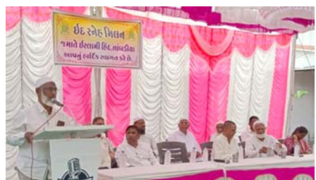
આયોજન કરનારા લોકો સાથે ઈદ સ્નેહ મિલન કાર્યક્રમનું આયોજન કરવામાં આવ્યું હતું.

હિંમતનગર, તા.૮ સાબરકાંઠા જિલ્લાના પોશીના તાલુકાના લાંબડિયા ખાતે જામાતે ઈસ્લામી હિંદ, લાંબડિયા દ્વારા લાંબડિયા મેમન સમાજ વાઘીમાં ઈદ સ્નેહ-મિલન કાર્યક્રમનું આયોજન કરવામાં આવ્યું હતું, જેમાં વિવિધ સમાજ અને વર્ગના લોકોએ ઉત્સાહપૂર્વક ભાગ લીધો હતો. જેમાં ભાઈચારા સમુદાયના લોકો પણ સામેલ રહ્યા હતા.