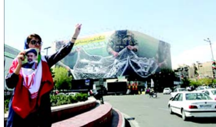
અસીમ મુનીર સાથેની વાતચીત બાદ બે અઠવાડિયા માટે ઈરાન પર બોમ્બમારો અને હુમલાઓ સ્થગિત કરવા સંમત થયા છે. ટ્રમ્પના જણાવ્યા મુજબ, બંને અધિકારીઓએ તે રાત્રે ઈરાન સામે 'વિનાશક બળનો ઉપયોગ' રોકવા વિનંતી કરી હતી, શરત એ હતી કે તેહરાન 'હોર્નુમુક્ટ સ્ટેટના સંપૂર્ણ, તાત્કાલિક અને સલામત ઉદ્ધાટન' માટે સંમત થાય.

(એજન્સી) ટા.૮ ઈરાનની સુપ્રીમ નેશનલ સિક્યુરિટી કાઉન્સિલે બુધવારે જણાવ્યું હતું કે તેણે 'મોટી જીત' મેળવી છે અને અમેરિકાને યુદ્ધવિરામ માટે ૧૦-મુદ્દાની ઈરાની દરખાસ્ત સ્વીકારવા દબાણ કર્યું છે, જ્યારે પુષ્ટિ આપી છે કે યુદ્ધ સમાપ્ત કરવા માટે એક માળખું તૈયાર થઈ ગયું છે અને બે અઠવાડિયાના યુદ્ધવિરામ દરમિયાન તેની ચર્ચા કરવામાં આવશે. કાઉન્સિલે કહ્યું કે આ કરારમાં ઈરાનને સંપૂર્ણ વળતર, મધ્ય પૂર્વના તમામ શાહાઓમાંથી યુએસ દળોને પાછા ખેંચવાનો અને 'પ્રતિકારની ધરી' તરીકે ઓળખાતા તમામ જૂથો સામે યુદ્ધનો અંત લાવવાનો સમાવેશ થાય છે. તેમાં ઈરાની દળો સાથે સંકલનમાં હોર્નુમુક્ટ સ્ટેટમાંથી પસાર થવાનું નિયમન, તમામ પ્રતિબંધો હટાવવા અને વિદેશમાં રાખેલી સ્થિર ઈરાની સંપત્તિઓને મુક્ત કરવાનો પણ સમાવેશ થાય છે. કાઉન્સિલે કહ્યું કે યુદ્ધ સમાપ્ત કરવાની વિગતોને અંતિમ સ્વરૂપ આપવા માટે આગામી શુક્રવારે ઈસ્લામાબાદમાં વાટાઘાટો થવાની છે. મંગળવારે સાંજે, યુએસ પ્રમુખ ડોનાલ્ડ ટ્રમ્પે કહ્યું કે તેઓ પાકિસ્તાનના વડાપ્રધાન શેહબાઝ શરીફ અને પાકિસ્તાનના આર્મી ચીફ ફિલ્ડ માર્શલ