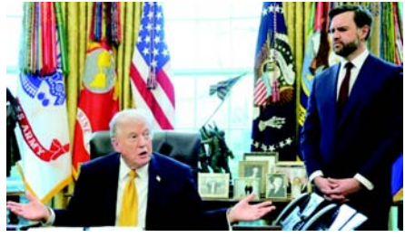
પછી પહોંચ્યા હતા, તેમણે ચેતવણી આપી હતી કે મોટા પાયે યુદ્ધ 'ખર્ચાળ' હશે અને તે પ્રદેશને અસ્થિર કરી શકે છે અને ચેતવણી આપી હતી કે ઈરાન અણધારી રીતે બદલો લઈ શકે છે. જોઈન્ટ ચીફ્સ ઓફ સ્ટાફના અધ્યક્ષ જનરલ ડેન કેને લશ્કરી શક્તિનું કાળજીપૂર્વક મૂલ્યાંકન કર્યું. તેમણે હોર્નુમુક્ટ સ્ટેટમાં સંભવિત વિસ્ફોટના જોખમો પર પણ વાત કરી અને તેમણે રાષ્ટ્રપતિને આગળ ન વધવાનું કહ્યું નહીં.

(એજન્સી) ટા.૮ ઈરાન સામે યુએસ-ઈઝરાયેલી લશ્કરી હુમલા પહેલાના અઠવાડિયામાં રાષ્ટ્રપતિ ડોનાલ્ડ ટ્રમ્પનું મંત્રીમંડળ કાર્યવાહીના જોખમો અને યોગ્યતાઓ અંગે વિભાજિત થયું હતું, જેમાં તેઓ ઈઝરાયેલના વડાપ્રધાન બેન્જામિન નેતાન્યાહુના આક્રમક વલણને સમર્થન આપ્યું હતું. વ્હાઈટ હાઉસમાં ટ્રમ્પે ડોનાલ્ડ ટ્રમ્પે કાર્યવાહી માટે આતુર છે અને 'જે. ડી. વાન્સ' પેટ્રિયો વચ્ચે વિભાજન થયું છે. ટ્રમ્પે તેમના રાષ્ટ્રપતિપદના કેટલાક સૌથી મહત્વપૂર્ણ નિર્ણયો કેવી રીતે લીધા હતા. યુદ્ધ પહેલાના આ આંતરિક વિભાજનોને અહેવાલ આગામી પુસ્તક, 'રિજીમ યેજ: ઈન્સાઈડ ઓફ ઈમ્પીરિયલ પ્રેક્ષિસીઝ' ઓફ ડોનાલ્ડ ટ્રમ્પે માટે રિપોર્ટિંગમાંથી લેવામાં આવ્યો છે. તે દર્શાવે છે કે, કેવી રીતે ન તો ગુનચર કે ન તો ઉપરાષ્ટ્રપતિ તે ઈચ્છતા હતા અને અન્ય લોકોએ પણ તેની સામે ચેતવણી આપી હતી, પરંતુ યુએસ રાષ્ટ્રપતિએ પોતાનું મન બનાવી લીધું હતું અને ઈઝરાયેલના વડાપ્રધાન નેતાન્યાહુ સાથે સુસંગત હતા. આ રિપોર્ટિંગ દર્શાવે છે કે, ટ્રમ્પના ઘણા મહિનાઓથી નેતાન્યાહુના વિચારો સાથે જોડાયેલા હતા, રાષ્ટ્રપતિના કેટલાક મુખ્ય સલાહકારોએ પણ તેના વિશે કહ્યું હતું અને તે દર્શાવે છે કે, અંતે, ટ્રમ્પના યુદ્ધ મંત્રીમંડળના વધુ શંકાસ્પદ સભ્યો (શ્રી વાન્સના અપવાદ સિવાય), વ્હાઈટ હાઉસની અંદરની વ્યક્તિ સંપૂર્ણ પાયે યુદ્ધનો સૌથી વધુ વિરોધ કરે છે.