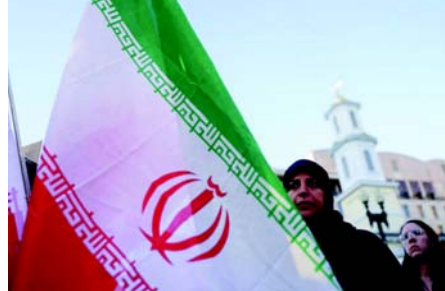
જેનાથી કોઈપણ ખતરો પ્રત્યેની જાહેર ધારણા ખાસ કરીને સુસંગત બની હતી. ૨૦ માર્ચનો FBI રિપોર્ટ રાષ્ટ્રીય સુરક્ષા પારદર્શિતા બિનનફાકારક સંસ્થા પ્રોપર્ટી ઓફ ધ પીપલ દ્વારા પુલ્વ્યા રેકોર્ડ વિનંતીઓ દ્વારા મેળવવામાં આવ્યો હતો અને રોઈટર્સ સાથે શેર કરવામાં આવ્યો હતો. આ રિપોર્ટમાં સંઘર્ષ શરૂ થયા પછી ઈરાની સરકાર દ્વારા યુ.એસ.માં લક્ષ્યો માટે 'વધેલા ભૌતિક જોખમો' પર પ્રકાશ પાડવામાં આવ્યો હતો. 'વિવિધ વૈચારિક પૂર્ણભૂમિ ધરાવતા હિંસક ઉગ્રવાદીઓ, જેમાં યુએસ અથવા ઈઝરાયેલનો વિરોધ કરનારાઓનો પણ સમાવેશ થાય છે, તેઓ પણ આ સંઘર્ષને હિંસા માટે વાજબી દેરવી શકે છે,' અહેવાલમાં જણાવાયું છે. અહેવાલમાં જણાવાયું છે કે ઈરાની સુરક્ષા સેવાઓએ તાજેતરના વર્ષોમાં અમેરિકનોનું અપહરણ અને હત્યા કરવાનો પ્રયાસ કર્યો છે. જ્યારે તે કહે છે કે યુ.એસ.માં મોટાભાગના કાવતરાઓમાં હથિયારોનો સમાવેશ થાય છે, અન્ય પદ્ધતિઓમાં 'છરાબાજી, વાહન અકસ્માત, બોમ્બ ધડાકા, ઝેર, ગળું દબાવવા, ગૂંગામણ અને આગ લગાડવાનો સમાવેશ થાય છે.' અહેવાલમાં જણાવાયું છે કે તેહરાન અમેરિકામાં કાનૂની દરરૂઠી ધરાવતા અથવા અમેરિકામાં પ્રવેશ ધરાવતા કાર્યકરોનો ઉપયોગ કરવાનું પસંદ કરે છે. ભૂતકાળમાં ઈરાની સરકારે લક્ષ્યો પસંદ કરવા અને સુરક્ષા પગલાંનું મૂલ્યાંકન કરવા માટે સોશિયલ મીડિયા, લાઈવસ્ટ્રીમ અને મેપ એપ્લિકેશન્સ પર નજર રાખી હતી, અહેવાલમાં જણાવાયું છે કે સરકારે ફિશિંગ ઈમેલ જેવી હેરિંગ યુક્તિઓનો પણ ઉપયોગ કર્યો હતો. ઈરાની સરકારે 'ભોગીઓને ભૌગોલિક રીતે ઈરાનની નજીકના અન્ય આંધ્રો ન હતો. સંયુક્ત રાષ્ટ્રમાં ઈરાની મિશનના પ્રવક્તા અલી કરીમી મધ્યે ટિપ્પણી કરવાનો ઈનકાર કર્યો હતો. અમેરિકનો યુદ્ધ પ્રત્યે નકારાત્મક વિચારો ધરાવે છે, બે તૃતીયાંશ લોકોએ કહ્યું હતું કે અમેરિકાએ ઝડપથી તેની સંડોવણીનો અંત લાવવો જોઈએ, ગયા મહિને રોઈટર્સ/ઈપ્સોસના મતદાનમાં જણવા મળ્યું હતું,