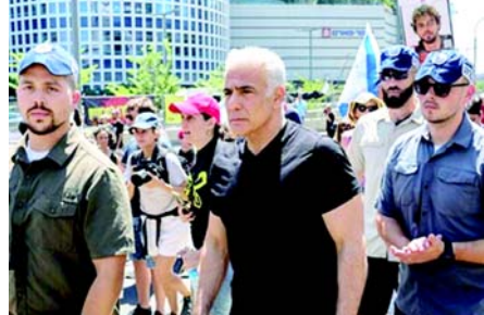
વચન આપ્યું હતું અને વ્યવહારમાં, અમને ઈઝરાયેલ દ્વારા અત્યાર સુધીની સૌથી ગંભીર વ્યૂહાત્મક નિષ્ફળતાઓમાંની એક મળી,' ગોલાને X પર કહ્યું. 'તે એક સંપૂર્ણ નિષ્ફળતા છે જે આવાના વર્ષો માટે ઈઝરાયેલની સુરક્ષાને જોખમમાં મૂકે છે.' સંસદ સભ્ય અને વિપક્ષી નેતા એવિગ્ડોર લિબરમેને પણ યુદ્ધવિરામની નિંદા કરી, કહ્યું કે તેનાથી ઈરાની શાસનને 'ફરીથી સંગઠિત થવાની તક' મળી. 'ઈરાન સાથેના કોઈપણ કરારમાં જેમાં ઈઝરાયેલનો વિનાશ, યુરેનિયમ સંવર્ધન, બેલિસ્ટિક મિસાઈલનું ઉત્પાદન અને પ્રદેશમાં આંતરકવાદી સંગઠનોને ટેકો આપવાનો ઈનકાર શામેલ નથી, તેનો અર્થ એ છે કે આપણે વધુ મુશ્કેલ પરિસ્થિતિઓમાં બીજા અભિયાનમાં પાછા ફરવું પડશે અને ભારે કિંમત ચૂકવવી પડશે,' લિબરમેને X પર જણાવ્યું હતું. યહૂદી રજા પાસઓવરના અંત પછી બુધવારે વધુ પ્રતિક્રિયા આવવાની અપેક્ષા હતી. ઈઝરાયેલે ઈરાન સાથે ટ્રમ્પની યુદ્ધવિરામ યોજાવવાને સમર્થન આપ્યું હોવા છતાં, તેણે કહ્યું કે યુદ્ધવિરામમાં લેબેનોનનો સમાવેશ થતો નથી. યુદ્ધના પહેલા દિવસે ઈરાનના સર્વોચ્ચ નેતા આયાતુલ્લાહ અલી ખામેનીની હત્યા પછી માર્ચમાં લેબેનોન સશસ્ત્ર જૂથે ઈઝરાયેલ પર રોકેટ ફાયર કર્યા પછી ઈઝરાયેલ હિઝબુલ્લાહ સાથે યુદ્ધ લડી રહ્યું છે.