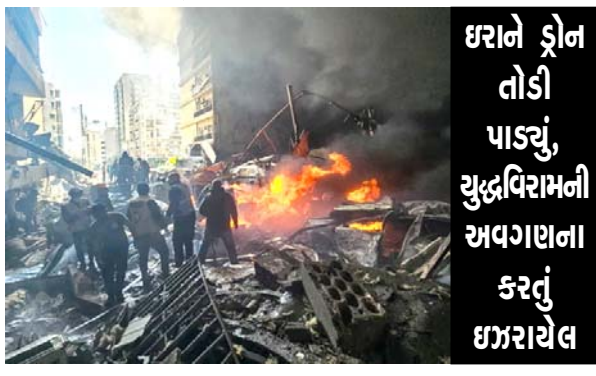
ઇરાને ડ્રોન તોડી પાડ્યું, યુદ્ધવિરામની અવગણના કરતું ઈઝરાયેલ

ન્યૂઝ એજન્સી દ્વારા ઘાયલ થયેલા આવા લેબેનોન અનુસાર, ઈરાનના ઈસ્લામિક રિવોલ્યુશનરી ગાર્ડ કોર્પ્સે લેબેનોન પર ઈઝરાયેલના હુમલાઓને 'બેરૂતમાં ફૂર હત્યાકાંડ' ગણાવીને વખોડી કાઢ્યા છે. 'જો આપણા પ્રિય લેબેનોન સામેના આક્રમણો તાત્કાલિક બંધ નહીં થાય, તો અમે પ્રદેશના દુષ્ટ આક્રમકારકોને ખેદજનક જવાબ આપીશું.'