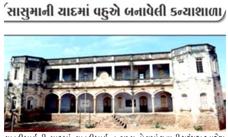
લાડકીબાઈની યાદમાં લાડકીબાઈ કન્યાશાળા શરૂ કરી હતી. વઢવાણ પંચકમાં કન્યા કેળવણીનો પ્રયત્ન જટિલ હતો. આથી કન્યાઓ ભણીને આગળ આવી શકે તે માટે લાડકીબાઈ કન્યાશાળાનો પ્રારંભ થયો હતો. આ કન્યાશાળાની ઐતિહાસિક ભવ્ય ઇમારત અને શ્રેષ્ઠ સુવિધાને લીધે આ શાળામાં હજારો બાળકો, ૧૦૦થી વધુ શિક્ષકો, ૧૦૫ટાવાળા હોવાથી ધમધમતી જોવા મળી હતી. દરેક સરકારી કાર્યક્રમ આ શાળાના મુખ્ય હોલમાં ધવાની પરંપરા અર્થે પણ અકબંધ છે. ત્યારે વર્ષ ૨૦૦૧માં ભયાનક ભૂકંપ છતાં લાડકીબાઈ કન્યાશાળા અડીપમ હતી. પરંતુ સતત ભૂકંપ આંચકાને લીધે ઐતિહાસિક ઇમારત જર્જરિત બની રહી છે. આથી ઉપરના મજલાઓ અને રૂમોમાં શિક્ષણ અપાય તેવી સ્થિતિ રહી નથી. ભવ્ય ભૂતકાળ, વિસ્મરણીય વર્તમાન ધરાવતી લાડકીબાઈ કન્યાશાળા સોનેરી ભવિષ્યકાળને ગંભીર રહી છે.

(સંવાદદાતા દ્વારા) સુરત, તા. ૪ ગુજરાત રાજ્યમાં કન્યા કેળવણી અને મહિલા સન્માનને મોટી-મોટી વાતો થઈ રહી છે. સામાન્ય રીતે સાસુ-વહુના સંબંધો સુમેળપૂર્ણ જોવા મળતા નથી. ત્યારે વહુએ સાસુની યાદમાં વર્ષ ૧૯૨૦માં લાડકીબાઈ કન્યાશાળા બનાવી હતી. પરંતુ ભૂકંપમાં આ ઐતિહાસિક ઇમારત જર્જરિત થઈ હતી. ૧૫ ડિસેમ્બરે લાડકીબાઈ કન્યાશાળાએ ૮૫ વર્ષ પૂરા કર્યા છે ત્યારે ભવ્ય ભૂતકાળ, વિસ્મરણીય વર્તમાન ધરાવતી કન્યાશાળા ભવ્ય ભવિષ્યકાળ ગંભીર રહી છે.