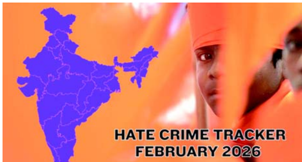
HATE CRIME TRACKER FEBRUARY 2026

(એજન્સી) નવી દિલ્હી, તા. ૪ આ વર્ષે ફેબ્રુઆરી ૨૦૨૬માં સમગ્ર ભારતમાં ઓછામાં ઓછા ૬૭ નફરતના ગુના નોંધાયા છે, જે જાન્યુઆરીના આંકડા કરતાં ૫૮.૫ ટકા વધુ છે. ઉત્તર પ્રદેશમાં સૌથી વધુ ૨૦ કેસ નોંધાયા, ત્યારબાદ તેલંગાણામાં ૧૪ કેસ નોંધાયા. જેમાંથી ૧૩ મુસ્લિમો વિરુદ્ધ અને એક દલિતો વિરુદ્ધ હતો. તેલંગાણાના પાંચ કેસ ફક્ત હેટરાબાદમાં જ હતા.