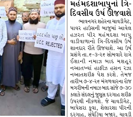
જંબુસર શહેર અને તાલુકામાં મુસ્લિમ સમાજ દ્વારા યુસીસી કાયદાના વિરોધમાં શાંતિપૂર્ણ રીતે વિરોધ નોંધાવવામાં આવ્યો હતો. આ વિરોધ કાર્યક્રમ અંતર્ગત શહેર તેમજ તાલુકાની તમામ મસ્જિદોમાં અને મસ્જિદોના બહાર મુસ્લિમ સમાજના લોકોએ કાળી પટ્ટી બાંધી પોતાનો વિરોધ વ્યક્ત કર્યો હતો. જુમ્માની નમાઝ બાદ મોટી સંખ્યામાં સમાજના લોકોએ એકત્રિત થઈ આ કાયદા સામે પોતાની અસહમતિ દર્શાવી હતી. સમાજના આગેવાનો દ્વારા જણાવાયું હતું કે આ વિરોધ સંપૂર્ણ રીતે લોકશાહી અને શાંતિપૂર્ણ પ્રદર્શિત કરવામાં આવ્યો હતો.