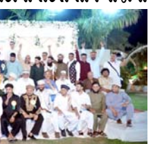
અમદાવાદ, તા.૩ અમદાવાદના Z.K. ફાર્મ ખાતે પઠાણ કલ્ચરલ એન્ડ સોશિયલ કમિટીની તરફથી ઈદ મિલન કાર્યક્રમનું ભવ્ય આયોજન કરવામાં આવ્યું. આ પ્રસંગે સમાજના તમામ યુવા સભ્યોએ ઉત્સાહભરે ભાગ લીધો અને એકતા, ભાઈચારો અને પ્રેમનો સંદેશ આપ્યો.

એકતા અને સંસ્કૃતિની પ્રશંસા કરી. કાર્યક્રમ દરમિયાન સમાજના આગેવાનો અને મહેમાનોનું સન્માન કરવામાં આવ્યું. સાથે જ, સમાજ દ્વારા એક NGO જેવી સેવા ભાવનાથી ગરીબ અને જરૂરિયાતમંદ લોકોને મદદ કરવામાં આવે છે, પાસ કરીને શિક્ષણ ક્ષેત્રે પુસ્તકો અને અન્ય સહાય આપવામાં આવે છે, તે બાબત પણ ઉલ્લેખનીય રહી. વસ્તાઓએ યુવા પેઢીને ઈમાનદારી અને મહેનતનો માર્ગ અપનાવવા પ્રેરણા આપી અને જણાવ્યું કે શિક્ષણ આજના સમયમાં ખૂબ જ જરૂરી છે. પઠાણ સમાજના ઘણા લોકો આજે સારા પદ પર અને વ્યવસાય ક્ષેત્રે સફળતા મેળવી રહ્યા છે તે ગૌરવની વાત છે.