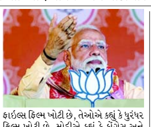
કાઈલ્સ ફિલ્મ ખોટી છે, તેઓએ કહ્યું કે ધુરંધર ફિલ્મ ખોટી છે. મોદીએ કહ્યું કે કોંગ્રેસ અને ડાબેરીઓ “જૂઠાણાનું કારખાનું” બની ગયા છે અને તેમના પર વિદેશી યોગદાન (નિયમન) અધિનિયમ (FCRA) અને સમાન નાગરિક સંહિતા (UCC)માં તાજેતરના સુધારાઓ પર ગભરાટ ફેલાવવાનો આરોપ લગાવ્યો હતો. તેમણે કહ્યું કે, આજકાલ, તેઓ FCRA અને UCC વિશે જૂઠાણા ફેલાવી રહ્યા છે. ગોવામાં દાયકાઓથી UCC છે, પરંતુ તેઓ તેના વિશે જૂઠાણા ફેલાવી રહ્યા છે. તેઓએ CAA સાથે પણ આ બંધ જ કર્યું છે. મોદીએ પાર્ટી પર ધરે, “ઉદ્દેશીજનક” ટિપ્પણીઓ કરીને ઈરાન અને ગલ્ફ દેશોમાં રહેતા લગભગ એક કરોડ ભારતીય સ્થળાંતર કરનારાઓના જીવનને જોખમમાં મુકવાનો પણ આરોપ લગાવ્યો. મોદીએ દાવો કર્યો કે કોંગ્રેસ સૂટકી લાભ માટે આ સ્થળાંતર કરનારાઓની સલામતીને જોખમમાં મુકવાને તૈયાર છે અને પશ્ચિમ એશિયામાં તણાવ ઉદ્દેશ્ય બદલ પાર્ટીની ટીકા કરી. તેમણે ચેતવણી આપી કે આવી બેજવાબદાર ટિપ્પણીઓ મધ્ય પૂર્વમાં ભારતની “મજબૂત સ્થિતિ”ને અસર કરી શકે છે. તમિલનાડુ, ગોવા, કેરળ, તેલંગાણા અને પુડુચેરીના ભારતીય માછીમારો હાલમાં ઈરાનમાં કામ કરી રહ્યા છે. સરકાર તેમને બચાવવા માટે સક્રિયપણે કાર્યરત છે, સંકડો પહેલાથી જ

(એજન્સી) નવી દિલ્હી, તા. ૪ વડાપ્રધાન નરેન્દ્ર મોદીએ શનિવારે કોંગ્રેસ અને ડાબેરીઓ પર આકરા પ્રહારો કરતા કહ્યું કે જ્યારે તેઓ કેરળ સ્ટોરીથી ધુરંધર જેવી ફિલ્મો માટે બધું જ જૂઠું બોલે છે અને તેઓ “જૂઠું બોલવામાં નિષ્ણાત બની ગયા છે.” કેરળના તિરૂવલ્લામાં એક રેલીને સંબોધતા પ્રધાનમંત્રીએ કહ્યું કે, LDF અને UDF જૂઠું બોલવામાં નિષ્ણાત બની ગયા છે. તેઓએ કહ્યું કે કેરળ સ્ટોરી ફિલ્મ ખોટી છે, તેઓએ કહ્યું કે કાશ્મીર