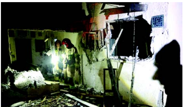
સારવાર આપવામાં આવી હતી અને તેને હોસ્પિટલમાં લઈ જવામાં આવ્યો હતો. સેનાએ પાછળથી જણાવ્યું હતું કે નાગરિકોને દેશભરમાં સુરક્ષિત જગ્યાઓ

(એજન્સી) જેરુસલેમ, તા. ૪ ઈઝરાયેલી સેનાએ શનિવારે જણાવ્યું હતું કે તેના હવાઈ સંરક્ષણ તંત્ર ઈરાનથી છોડવામાં આવેલી મિસાઈલોને નીચે પાડવા માટે કામ કરી રહ્યા છે, જેમાં એક વ્યક્તિ ઘાયલ થયાની જાણ થઈ છે. ફેબ્રુઆરીના અંતમાં યુએસ-ઈઝરાયેલી બોમ્બમારો શરૂ થયો ત્યારથી ઈઝરાયેલ અને ઈરાન મિસાઈલ હુમલાઓનો વેપાર કરી રહ્યા છે, જેમાં ઈરાનના સર્વોચ્ચ નેતા આયાતુલ્લાહ અલી ખામેનાઈની હત્યા થઈ હતી અને તે વ્યાપક પ્રાદેશિક યુદ્ધમાં ફેરવાઈ ગયું હતું. સેનાએ ટેલિગ્રામ પર જણાવ્યું હતું કે, "રક્ષણાત્મક પ્રણાલીઓ ધમકીને રોકવા માટે કાર્યરત છે." ઈઝરાયેલના મેગેન ડેવિડ એ ડો મેમ્બર જર્મી સર્વિસે જણાવ્યું હતું કે મધ્ય શહેર બ્નેઈ બ્રાકમાં કાયના છરાથી થયેલી નાની ઈજાઓ માટે ૪૫ વર્ષિય વ્યક્તિને