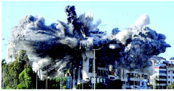
અધિકારીઓએ જણાવ્યું હતું કે ઈઝરાયેલી હુમલામાં અત્યાર સુધીમાં લગભગ ૧,૩૬૮ લોકો માર્યા ગયા છે અને ૯૮૩ અન્ય ઘાયલ થયા છે.

(એજન્સી) તા. ૪ લેબેનોનના આરોગ્ય મંત્રાલયે ગુરુવારે જણાવ્યું હતું કે લેબેનોન પર ઈઝરાયેલી હુમલાઓમાં છેલ્લા ૨૪ કલાકમાં ૨૩ લોકો માર્યા ગયા છે અને ૯૮ અન્ય ઘાયલ થયા છે. નેશનલ ન્યૂઝ એજન્સી દ્વારા પ્રસારિત એક નિવેદનમાં, મંત્રાલયે ઉમેર્યું હતું કે ૨ માર્ચથી અત્યાર સુધીમાં કુલ મૃત્યુઆંક ૧,૩૬૮ થયો છે, જેમાં ૪,૧૩૮ લોકો ઘાયલ થયા છે. આ સંખ્યામાં ૧૨૫ બાળકો અને ૯૧ મહિલાઓનો સમાવેશ થાય છે. ૨ માર્ચે હિઝબુલ્લાહ દ્વારા સરહદ પારના હુમલા બાદ ઈઝરાયેલે લેબેનોન પર હવાઈ હુમલો કર્યો છે અને દક્ષિણમાં જમીની હુમલો શરૂ કર્યો છે. લેબેનોનના