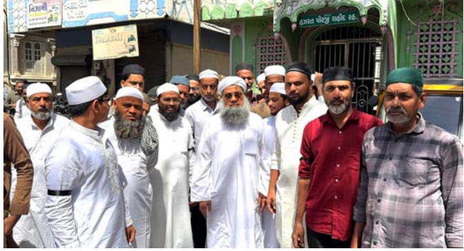
વડોદરા શહેરમાં મુસ્લિમ સમાજ દ્વારા જુમ્માની નમાઝ બાદ કાળી પટ્ટીઓ બાધી UCCના કાયદાનો વિરોધ કરાયો હતો. આ દરમિયાન લોકો પોતાના હાથ પર કાળી પટ્ટી બાંધી તેમજ પ્લેકાર્ડ ધરાવીને ગુજરાત સરકાર દ્વારા લાવવામાં આવેલા યુનિફોર્મ સિવિલ કોડ બિલ સામે વિરોધ વ્યક્ત કર્યો હતો.